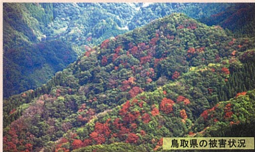
鳥取県の被害状況

岡山県におけるナラ枯れ被害は、平成21年に初めて鳥取県境付近で確認されました。その後、県北東部の市町村で急速に拡大しており、被害の早期発見と早期防除に努めることが最も重要です。